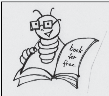
Buddie – der Bücherwurm von budrich academic

Füttere Buddie mit Deiner Buchbesprechung!